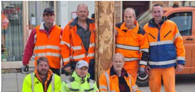
Das Bauhofteam stellte in Gramatneusiedl den 25-Meter-Baum auf.