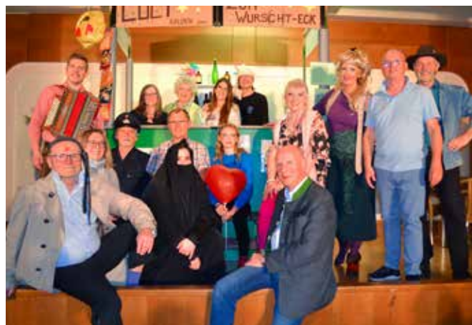
Das Ensemble berührte das Publikum.

Beim Würstelstand bestellt er „braun angebrannten Toast“ obwohl ihm die Würstelstandbesitzerin Balonik lieber „Pferdeleberkäs vom letzten Polizeipferd, nicht geimpft aber dafür entwurmt“ servieren würde.