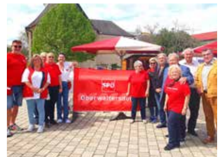
1. Mai bei der SPÖ in Oberwaltersdorf