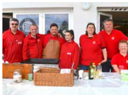
SPÖ Neufeld lud zum Familienfest.