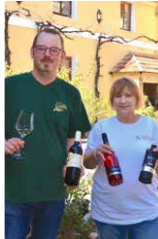
Dachauer in der Mühle mit Partner Schorn Erdbeeren

Zur Abrundung hatte noch jeder Betrieb einen kulinarischen Genusspartner eingeladen, bei dem regionale Köstlich-