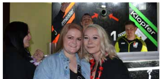
Geschickte schafften das Zielschießen mit Klopfer und Jägermeister.

Für die Sicherheit sorgte das große Security-Team. So konnte bis in die frühen Morgenstunden richtig ausgelassen Party gemacht werden.