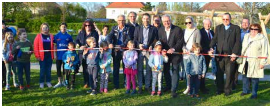
Die Ehrengäste durchschnitten gemeinsam mit Kindern das Eröffnungsband.