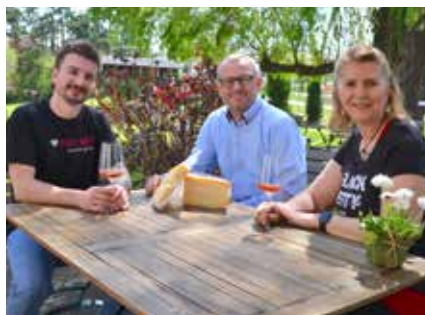
Landauer-Gispert mit Partner Maxreicom