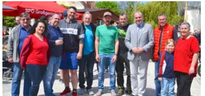
SPÖ Team TSV stellte händisch in Siegersdorf den Maibaum auf.