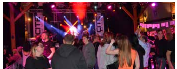
Im Anschluss an die Trophy wurde beim Scheunenrock gefeiert.

Die 16 besten Mannschaften konnten sich für das Achtelfinale qualifizieren. Ab diesem ging es im K.O.-System weiter, um den Sieger am Ende des spannenden Wettbewerbs zu küren.