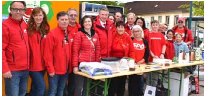
SPÖ Ebreichsdorf feierte in Unterwalterdorf (Bild) und Weigelsdorf