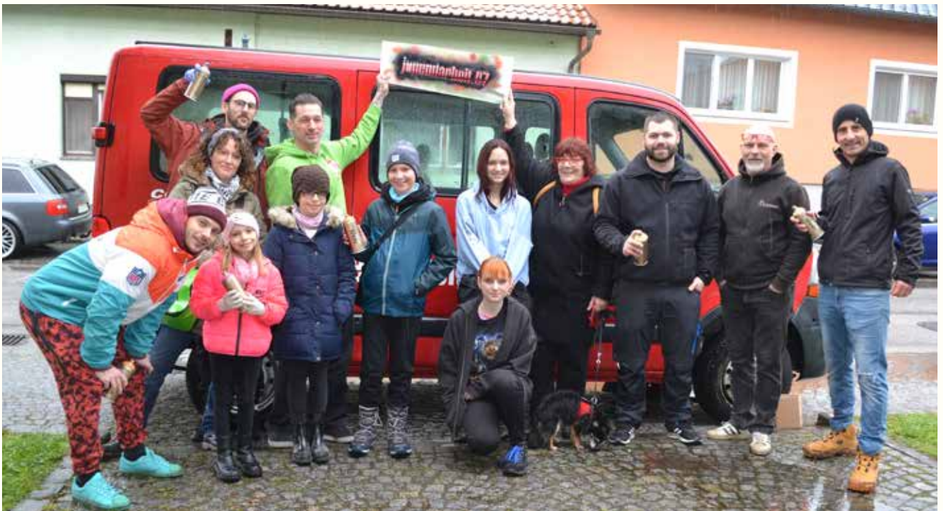
Trotz sprichwörtlichen „Schusterbuam-Regens“ kamen fast 30 Kinder und Jugendliche zum Graffiti-Workshop der Gemeinde Mitterndorf. Im Laufe des Nachmittags entstanden wahre Kunstwerke. (Seite 33)