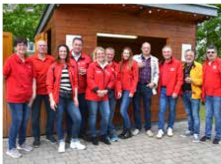
In Ebenfurth feierte die SPÖ den 1. Mai.