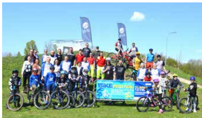
Erstes Bike-Festival auf der Piestingauwiese

Was fix ist: „Das Bike Festival geht 2024 in die Verlängerung“, versprach Dallinger.