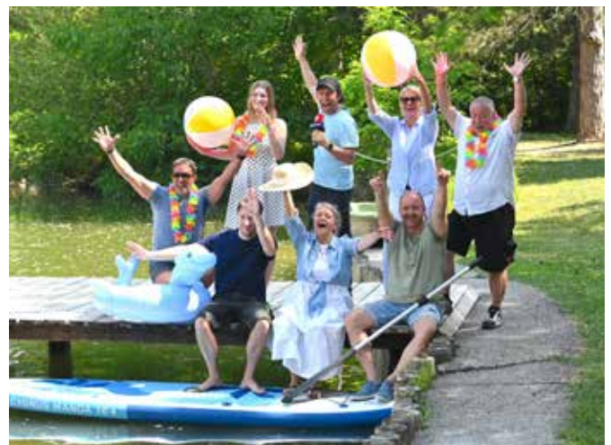
Das Team der Bettfedern verspricht beste OPEN AIR-Stimmung.

Während der OPEN AIR-Abende werden Lose verkauft, deren Reinerlös einem guten Zweck zugutekommt. Die Einnahmen