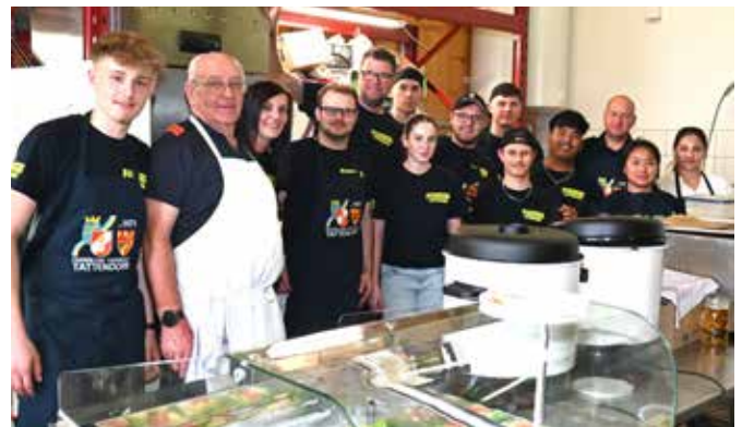
Die Küchenmannschaft hatte alle Hände voll zu tun.