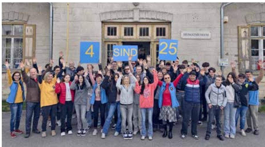
Die Polyschüler mit dem Team der ARGE-Heimatsforschung

Neu gestaltet wurde die Ausstellung über die Hutfabrik. Die bewährten Inhalte präsentieren sich jetzt mo-