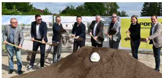
Startschuss für das neue Multifunktionszentrum

anderem die Drogeriekette Müller sowie der Schuhdiskonter Deichmann ansiedeln werden.