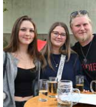
Auch die Jugend feierte mit.

Für beste Unterhaltung sorgte neben der hervorragenden Verpflegung und den exzellenten Tat-