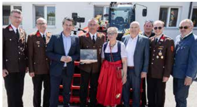
Alle sind stolz auf das neue Einsatzgerät.

Nenntragfähigkeit über vier Tonnen bietet es eine enorme taktische Flexibilität im Einsatz.