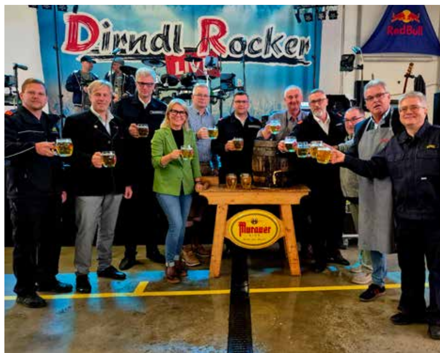
Der Bieranstich: Auftakt zu einem Abend mit viel Gaudi

Für Unterhaltung sorgte der Vergnügungspark von „Riedl's Freizeitbetriebe“ direkt vor dem Veranstaltungsgelände.